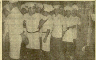
PREPARANDO LA SALIDA DE LA TAMBORRADA MASCULINA.