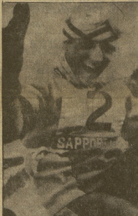
En Sappero, un esquiador español, Francisco Fernández Ochoa, conquistó en el "slalom" una medalla de oro de los Juegos. (Información en la 26.ª página.)