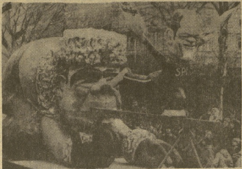
Willy Brandt, mantenido en difícil equilibrio, gracias a que Breznev lo sostiene con un dedo. Se trata de una caricatura alusiva a la "ostpolitik" de Brandt, expuesta en la parada que todos los años se celebra en la ciudad germana de Mayance.

China equiparada a la URSS en la "lista" comercial norteamericana