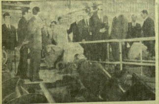
En la imagen podemos ver el núcleo de la G. Herrero... construido en la primera estación local y provisional...