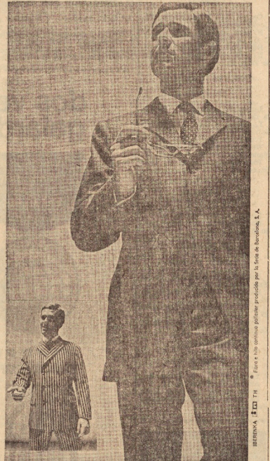
Luzca los nuevos trajes TERLENKA. Clásicos o avanzados, abiertos o cruzados. Elige libremente dentro de la elegancia TERLENKA.