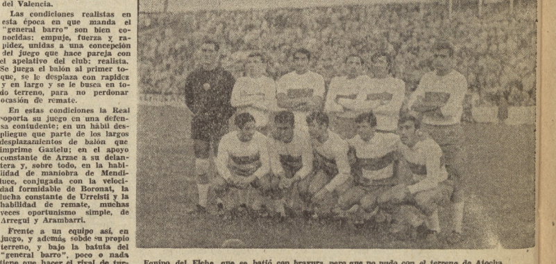
Equipo del Elche, que se batió con bravura, pero que no pudo con el terreno de Atocha.