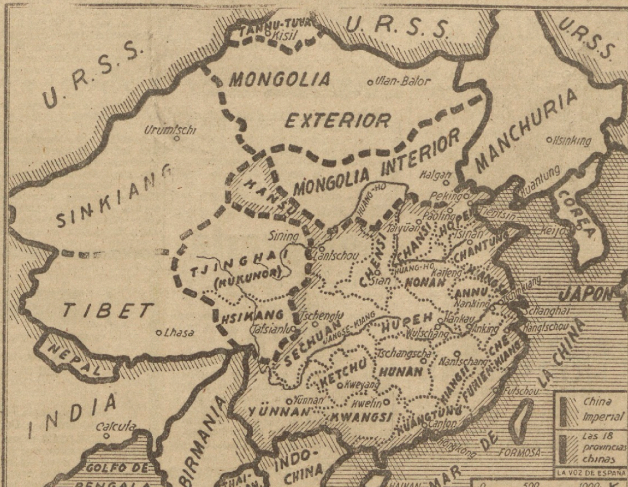
Arriba.—Los bailes simbólicos del diablo, en el que intervienen pintorescas figuras simbólicas, forman parte de los abundantes ritos religiosos mogoles. Abajo.—Mapa de la antigua China Imperial, señalando la situación de las dos Mogolias.