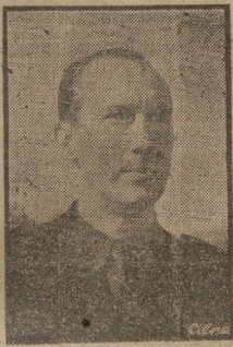
DON CARLOS REIN Ministro de Agricultura.

Bilbao, 9.—Bajo la presidencia del Obispo y con asistencia de las autoridades, en el Palacio Provincial se ha reunido la Junta Magna creada para la obtención de medios con que construir nuevos templos parroquiales en Bilbao. Se dio cuenta de la labor realizada durante el año que lleva de existencia esta Junta. Terminada la reunión, las autoridades y el Obispo marcharon al