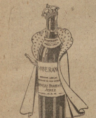
SOBERANO EL SOBERANO DE LOS CONACS GONZALEZ BYASS