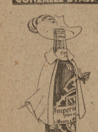
IMPERIAL TOLEDO VINO DE HEROS GONZALEZ BYASS