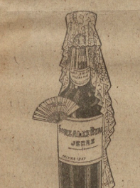
SOLERA 1847 UNICA EN SU ESTILO GONZALEZ BYASS