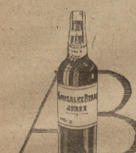
VINA AB UNIFINO DE BANDERA GONZALEZ BYASS