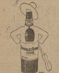
TIO PEPE JOL DE ANIVALLA EMBOTELLADO GONZALEZ BYASS