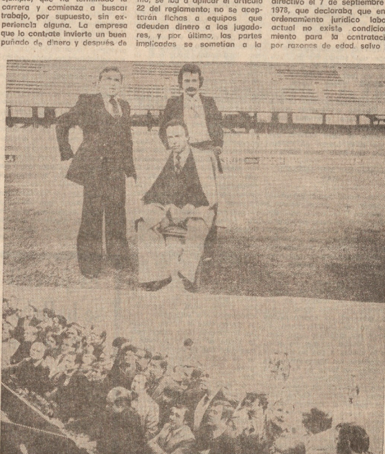
Barcelona. — También, de acuerdo con los consignos de la huelga de la AFE, tampoco ha habido fútbol en Barcelona. En la foto, arribado al campo posado para Empe en el centro del campo, sin equiparse, por ausencia de los jugadores. Y abajo un grupo de aficionados ante la tribuna presidencial esperando los acontecimientos.

Por último, solicitaban garantías de pago y un nuevo contrato de trabajo, en el que se declara de forma expresa el carácter laboral del mismo, configurando al club como empleador a efectos laborales.