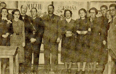
Consejo Nacional del acto de la inauguración de la Biblioteca Escolar de Marcella celebrada ayer en la Subdelegación del Estado de Pineda y Prrogarada.