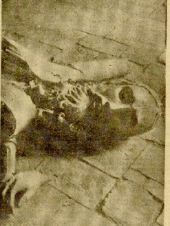
El silencio generalizado, tal como se muestra, resulta en las consecuencias de la acción militar, interrumpida, en su mayoría, por el ruido de las bombas que caen sobre la ciudad.