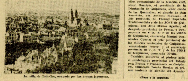
La villa de Tui-Tui, ocupada por las tropas japonesas. (Foto de la izquierda). (Foto de la derecha).