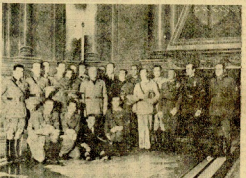
Los oficiales españoles heraldo, que van a embarcar en Roma, han sido recibidos por el Duque.