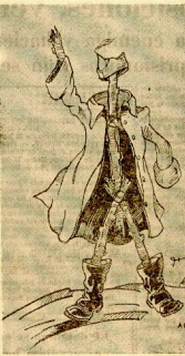
Nueva sistema que emplean nuestros soldados para el desarrollo de los ojos de los prisioneros.