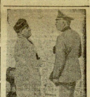
El Duce y el mariscal von Himmler saliendo a la revista marcial celebrada en Náples en honor del ministro de la Guerra del III Reich.