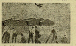
Un activista volando por encima de una fábrica de Niles para hacer saltar a los trabajadores convocados en ella.

Nuestra juventud excitada-que renunció al miedo y al fracaso-sólo tiene estos caminos certeros y trágicos: o vencer hasta el fin, con España en las manos, o morir matando con la calentísima pistola de su primera rebelión