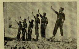
Las falansterios, desde el día de las tropas vascas, salieron al amanecer de un nuevo día que ha de traer un nuevo amanecer en el amanecer de la España Nueva, saliendo cubra.