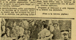
Una reunión política durante el debate en la Cámara francesa.

Una multitud de personas en un momento de la manifestación de Clichy. Una multitud de personas en un momento de la manifestación de Clichy. Una multitud de personas en un momento de la manifestación de Clichy.