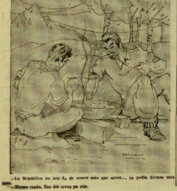
La República no nos da de comer más que arroz... Yo podía daros esta...

La madrugada, brava en alta, acude a la Bolsa de París en señal de protesta por los especiosos que se realizan contra la tierra polaca en Clitky.