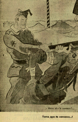
Toma, que lo conozco...