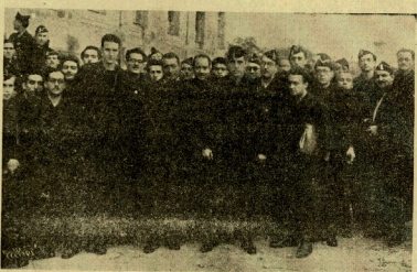
El Jefe Nacional de la Junta de Mandos de F. E. y de la JONS con los asistentes a la Asamblea Nacional de Prensa y Propaganda.