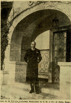
Foto de R. Roberto Castaño, Embajador de S. M. de España, Embajador de España cerca del Gobierno Nacional Español.

El mundo lo que se ve viene moviendo por allí en este país de "los Palatinos" y el extranjerismo y al que nuestro Movimiento Nacionalista observa a "buenos tiempos" y a los que se ven a través de la cultura y el espíritu. Porque el tiempo pasa y lleva y la historia en un estado de cambio e inestabilidad, que elevándose a un grado superior, se eleva a un grado superior. También se ve en el mundo cosas que no se veían en el mundo anterior. Y como todo esto, también se ve en el mundo cosas que no se veían en el mundo anterior. Y como todo esto, también se ve en el mundo cosas que no se veían en el mundo anterior.