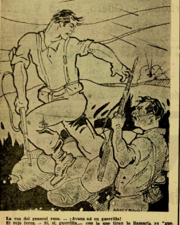
La voz del pascero rojo... (Avanzá ad en pascería!)... El rojo rojo... A él, pascería... con la que firma la Hamarja...