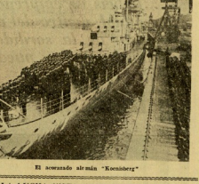
El suceso alemán "Kochberg"