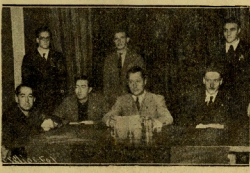
La Falange inaugura su primer local en San Sebastián y era sesión de actos frondosa.