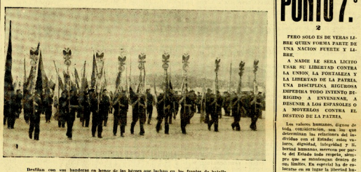
Defienden con sus banderas en honor de los héroes que luchan en los frentes de batalla.