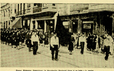
Falangistas marchando: la Revolución Nacional viene a su lado a luchar.