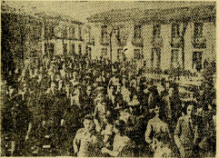
El Cañalito corría los campos de España y con sus infamadas, la día después...

La Falange necesita las armas y los cuerpos A PUNTO Y EN LINEA ES tensión, es elasticidad, es resistencia, es heroísmo, es ímpetu, es alegría, es subordinación absoluta a los mandos.