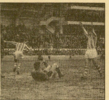
Un momento del partido...