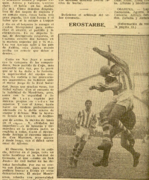
Ayer: Duhío mucho y después los hilones con colorido...