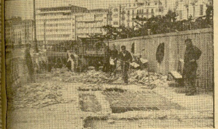
Aspecto al actual proyecto del paseo de la Concha, para proceder a la construcción de un nuevo techo del voladizo.

El voladizo es una «reivindicación» de lo que fue en 1910. En su interior, 450 metros, irán dos accesos subterráneos y dos bares