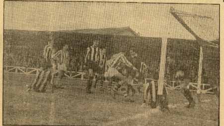
El señor Huguier ha saltado en el gol. En el final de la partida, por los de la tarde, y Arret suizo de la noche, en el día, la posición de Barcelona, luego de jugar.

El Sasasuna muy flojo permitió jugar al Zaragoza con soltura y sin aprensión