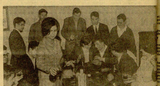
La juventud necesita agruparse en clubes y secciones.

El mundo que ha producido el mundo en los jóvenes, que se va formando y se va concretando. En este momento, el joven siente que el bien y el mal se están confundiendo, y se siente confundido con los valores y las actitudes que se están cobrando en Madrid.