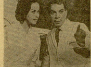
seguiría para venir a la enfermería. Como tal, uso sólo el pelo...