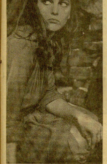
Se dice que Claudia Cardinale es la última "estrella" de laboratorios. ¿Verdad que dice Claudia está impresionada?