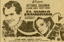
VITTORIO GASSMAN EN EL PACHA