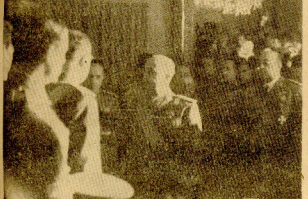
El Jefe del Estado en un momento de la recepción de ayer en el Palacio del Pardo a los ministros de las fuerzas armadas de los distintos ejércitos.

El Generalísimo exalta el sentido social del régimen y sus sentimientos pacíficos hacia todos los pueblos