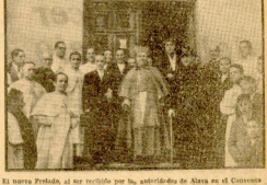
El nuevo Preboste al ser recibido por los señores de la Mesa de la Curia de San Sebastián de Murcia.