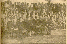
El camarero de Oriz y el alcalde de Oriz, presentando los platos de platos.

Espléndida actuación del manista Egito. El festival de Oriz constituyó un gran éxito. - Victorias de Gasteiz-Goluiño y Oñaindi-Alfaua. - Los resultados del Urumea