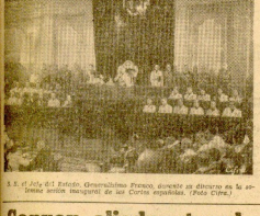
El 4.º día del Sesión, Gobernación Pradera, luego al Palacio de las Cortes para presidir la solemnidad inauguradora.

banderos adversarios fueron derribados sobre el mar por intensos cañonazos de las baterías de la Flota del B. A. de la zona del puerto del Atlántico. Después de una feroz batalla librada en el mar, los buques soviéticos fueron hundidos. En la noche del 16 de marzo, los buques de la Flota del B. A. de la zona del puerto del Atlántico, en el puerto de Staraya Rusia, fueron hundidos por los aviones de la Flota del B. A. de la zona del puerto del Atlántico. Los buques soviéticos fueron hundidos por los aviones de la Flota del B. A. de la zona del puerto del Atlántico.