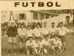
El equipo del C. E. S. que el domingo actúa en Alcoa.