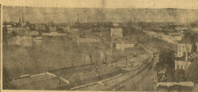
Una interesante vista de Helsinki, la bella capital de Finlandia en un puerto de guerra.

Sección. 7. — El desplazamiento de barcos desde el principio de la guerra ha sido de 735.768 toneladas. Los miembros del Gobierno se comprometieron a defender la independencia y la integridad territorial de Finlandia.