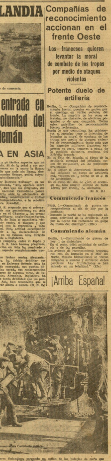
Sección. 11. — Se han hundido 194 barcos desde el principio de la guerra. Los miembros del Gobierno se comprometieron a defender la independencia y la integridad territorial de Finlandia.

Sección. 10. — El desplazamiento de barcos desde el principio de la guerra ha sido de 735.768 toneladas. Los miembros del Gobierno se comprometieron a defender la independencia y la integridad territorial de Finlandia.