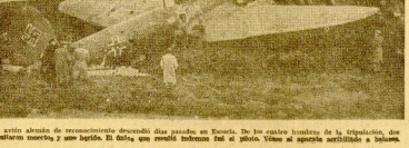
Un avión alemán de reconocimiento sobrevoló el puerto de Euzé. Los aviones alemanes de la brigada de los aviones de reconocimiento sobrevoló el puerto de Euzé. Los aviones alemanes de la brigada de los aviones de reconocimiento sobrevoló el puerto de Euzé.

Moscu.—El discurso pronunciado por el Comandante en Jefe del tercer Cuerpo expedicionario inglés en Francia. El discurso pronunciado por el Comandante en Jefe del tercer Cuerpo expedicionario inglés en Francia.