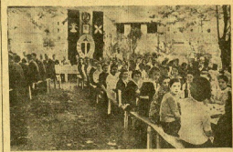
Al celebrar en publincaisón Discipliada, ha sido celebrado... el día 18 de junio, la fiesta del glorioso Ascension Nacional... La Fiesta de la Enaltación del Trabajo. Guipúzcoa, maritima e industrial, ha organizado en el mayor entusiasmo... una fiesta a los tres elementos productivos...