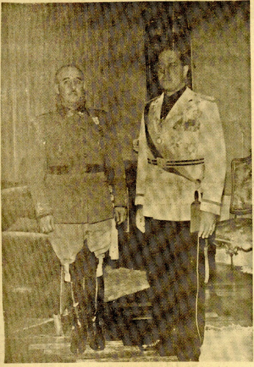
S. E. el Generalísimo recibe por primera vez, en el palacio de Ayete, al ministro de Asuntos Exteriores de Italia, S. E. el Conde Ciano, celebrando a continuación una extensa entrevista.

Visita a la bahía, a las obras del puerto y diversas factorías. - Un vino de honor en la Casa de la Junta de Obras del Puerto El Conde de Ciano visitó ayer la bahía de Pasajes, las obras del puerto y las factorías de "Buzas" y "Luzas". En la casa de la Junta de Obras del Puerto, está elido con un vino de honor.