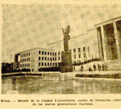
Roma. - Detalle de la ciudad universitaria, centro de formación cultural de las nuevas generaciones españolas.

La cultura tiene su origen en el momento de la creación y se desarrolla a lo largo de la historia de la humanidad. Es el fundamento de la civilización y el motor de su progreso. Sin cultura no hay sociedad humana que merezca el nombre de tal.