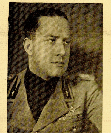
EXCELENCIA: España - y hoy, en su nombre, Guipúzcoa - os da la bienvenida a nuestro suelo.