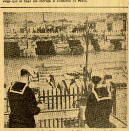
Vista del puerto de San Sebastián, ocupado momentáneamente por los japoneses.