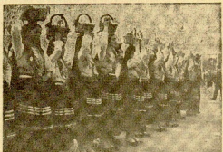
Un grupo de miembros de las unidades regimicas que toman parte en las labores de limpieza de las viviendas en Logroño.

Las fuerzas enemigas que con tanta calma venían combatiendo en las cercanías de Pinell y Mora de Ebro, se han retirado a las cercanías de Pinell y Mora de Ebro, pero en algunos puntos se encuentran a dos kilómetros escasos del río.