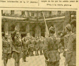
Uno de los soldados subidos hoy en alto en el momento de bajar la bandera.

Accidente de aviación Un trimotor, en el que viajaban conocidas personalidades que regresaban de la boda del Rey Zúlo, se ha incendiado y caído a tierra (Véase información en la 1.ª página.)