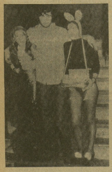
La dama, el pescador y el conde de la suerte.