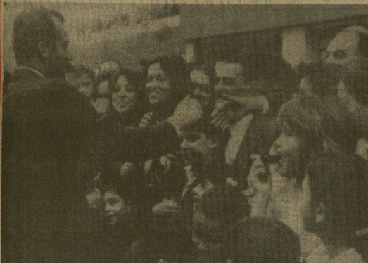
SANTA CRUZ DE TENERIFE. — El príncipe de España fue objeto de un cálida recepción por parte de los alumnos de la institución sindical Nueva Betosa de la Candelaria y centenares de vecinos de la barriada donde se halla dicho centro. En la foto, el príncipe estrechando la mano a numerosos personas que lo acaban de su llegada a la ciudad turística. — (Teléfono OFICIA GUSTICA)