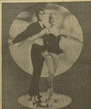
Tras conseguir un estuendo dñito en la sala de fiestas LA PERLA, se dispuso del público donostiarra la extraordinaria pareja inglesa de patinaje, "THE SKATING VALENTINES".