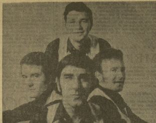
La discoteca TIFFANY'S y dentro de los martes saracatúcos, presenta el próximo día 13, en actuaciones de tarde y noche, a los creadores de "Marques Limón", "Albana Belén", "Martinet" y un largo etcétera de canciones conocidas, "LOS MARISMEÑOS", con la que os de esperar que la sala registre sendos llenos.

Los Marismeños, el próximo martes, en Tiffany's