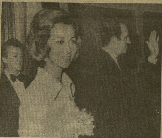
LAS PALMAS DE GRAN CANARIA. — Los príncipes de España, don Juan Carlos y doña Sofía, que han dado hoy por terminada su estancia en Canarias, asistieron anoche al teatro Pérez Galdós, para presenciar la representación de "Fipacetto", con la que se inauguró la temporada de ópera.

Los príncipes terminaron su estancia en Las Palmas