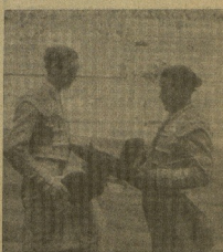
MOMENTO DE TALAVERA