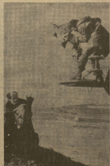
Un momento del rodaje de «La sombra de tu amor».

Los protagonistas principales de la nueva producción son Carmen Sevilla y López Vázquez. No se trata de una comedia cómica ni de una farsa, ni de un sainete. La película trata, por lo que más ha costado de su plan, en el más puro terreno dramático, aunque nunca falta ninguno de los valores técnicos técnicos y críticos. Es la historia de un ingeniero de prestigio que vive aislado, en una casa solitaria, lejos de su esposa, los amigos, le invitan para que ocurra a reuniones y reuniones en compañía de su mujer. El se excusa diciendo que su esposa está enferma y no puede acudir por motivos de salud. En la proximidad de la ciudad de artes, donde vive una mujer de vida más o menos «cuadrada» en compañía de su hijo. Esta mujer tiene un amante. Las relaciones entre ellos dos estruendos el ingeniero. Este así como se ve impresionado desahuciamiento en la vida de madre e hijo, que se ocuparán por «apagarse» de cuatro cuantos se va. Finalmente, desahuciamiento el ingeniero comedia dos escenas y un rollo a una reunión en compañía de su desahuciamiento.