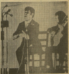
EL CANTOR JOSÉ MENESE.

—¿Cómo es el mundo dentro de José Menese? —Tarda casi un minuto en contestar a esta pregunta. No dice que abarca muchas cosas a la vez. Le damos tiempo para que piense.