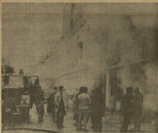
MADRID. — En la mañana de hoy continúan los trabajos de los bomberos para dominar el fuego que se declaró ayer en la fábrica de productos explosivos L'Oreal, de la calle Pajaritos, en Vallecas. Catorce coches, escalas y electroválvulas, con sus respectivos dotaciones, han trabajado sin descanso en la extinción del fuego. En la foto, una vista del lugar del siniestro.