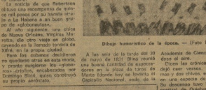
Dibujo humorístico de la época.