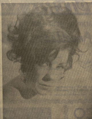
La sala de fiestas LA PERLA tiene el gusto de ofrecer hoy, sábado, y mañana, domingo, y dentro de un extraordinario programa, a ROSITA FERRER, que T.V.E. la proclamó como la mejor cantante de España.

DIA 22 DE MARZO, TARDE JUEVES SANGRIENTO ¡SI! PERO EN TIFFANY'S SIEMPRE HAY MAS AMBIENTE