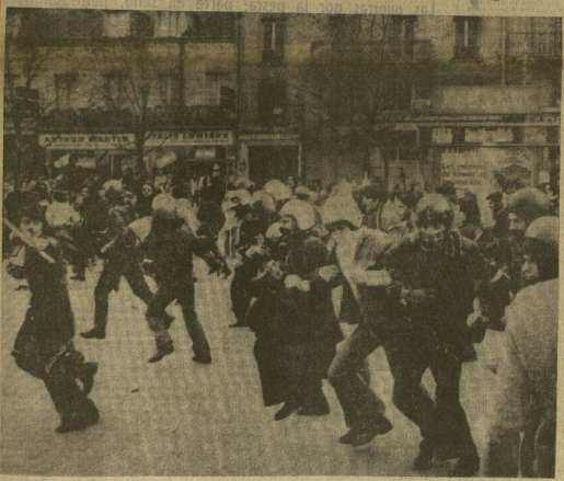
PARIS. — En la capital, como en otras poblaciones de Francia, ha habido manifestaciones de estudiantes convocadas por las organizaciones de la izquierda que protestaban contra la ley Dabry, que ha suprimido la prórroga del ingreso en el servicio militar por razón de estudios. Enfrentados a las fuerzas de la policía, se produjeron heridos por ambos partes.

Melón Carlos I Avda. Carlos I s/n. 16. - Teléfono 42670 LE OFECE Cocidos - Alubias Verduras del tiempo TODAS NUESTRAS GRANDES ESPECIALIDADES GRAN PARKING CON SUS YA COMODOS ACCESOS