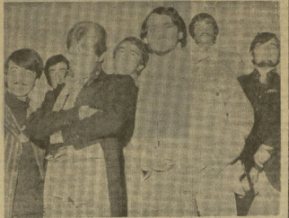
Hoy, en la sala de fiestas PENNY LANE, de Rentería, actúan, tarde y noche, el conjunto que triunfa dentro y fuera de nuestras fronteras, «LOS CANARIOS». Un espectáculo más de esta sala por presentar siempre las mejores atracciones.